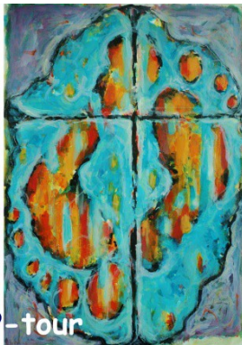
Titus Brandsma Parochie Leeuwarden

Op zaterdag 30 mei laat de Titus Brandsma Parochie van Leeuwarden zien dat zij niet meegaat in de teneur van afbraak van geloof of kerk, maar dat zij een levendige en dynamische parochie is, die het Woord van God integreert in het hedendaagse leven. Dat doet zij door een open dag te organiseren, waarbij diverse groepen uit de parochie laten zien hoe de Titus Brandsma Parochie een levende geloofsgemeenschap is.